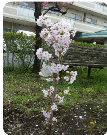
1か月前に植樹した御殿場桜も綺麗に咲きました