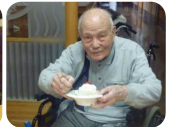
誕生日会で美味しいケーキを頂きました