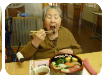
外食気分を味わいながらお寿司の出前を楽しみました