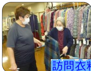
訪問衣料販売の様子